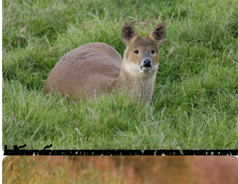
Водяной олень имеет длительный период беременности, который длится около 8 месяцев. Самки обычно рожают от 1 до 3 детенышей.