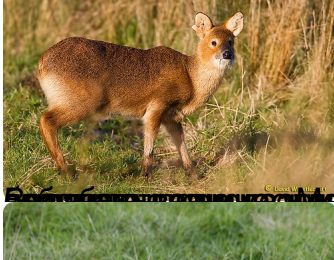
Водяной олень питается преимущественно растительной пищей, включая травы, листья и ветки деревьев. Он также может есть грибы и ягоды.