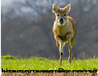
Водяной олень является быстрым и маневренным животным. Он может прыгать на высоту до 2 метров и преодолевать большие расстояния.