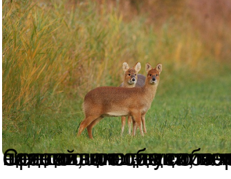
Водяной олень является важным элементом экосистемы. Он помогает поддерживать баланс в лесу, поедая лишнюю растительность.