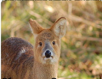
Водяной олень имеет длинную шею и большие глаза, что помогает ему видеть в темноте. Он также имеет сильные ноги, которые позволяют ему прыгать высоко.