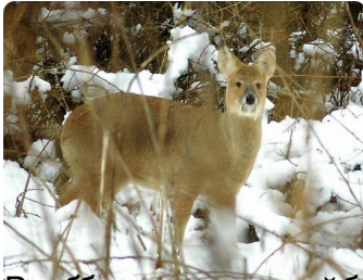
Водяной олень обитает в горах и на равнинах, в лесах и на открытых пространствах. Он встречается в Европе, Азии и Северной Америке.